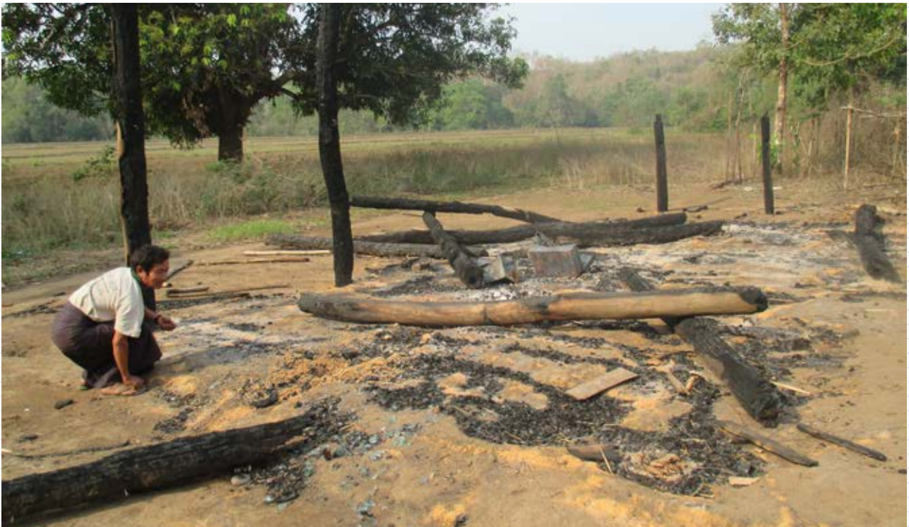
Un hombre en frente a lo que quedo de su casa quemada en la aldea de Tha Nay Moo, luego de enfrentamientos entre el Ejército de Myanmar y el Ejército Democrático Budista Karen o (DKBA).

Karen Human Rights Group (KHRG), Karen Environmental and Social Action Network (KESAN), Thwee Community Development Network (TCDN).