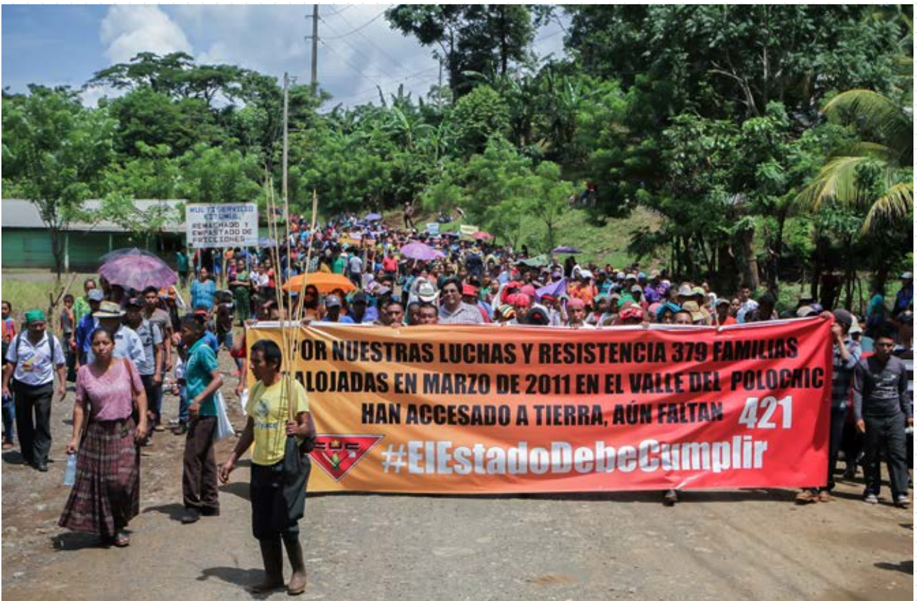
Se da un impulso en la lucha contra los desalojos en Guatemala: nos hace un poco más valientes. Caso Polochic

Oxfam, Action Aid, Comité de Unidad Campesina CUC.